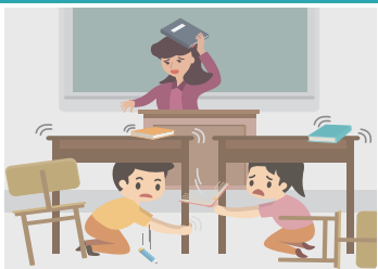
학교에 있을 경우

책상 아래로 들어가 책상 다리를 꼭 잡습니다. 흔들림이 멈추면 질서를 지키며 운동장 으로 대피합니다.