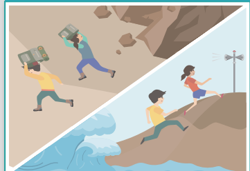
산이나 바다에 있을 경우

산사태, 절벽 붕괴 에 주의하고 안전한 곳 으로 대피합니다. 해안에서 지진해일 특보 가 발령되면 높은 곳 으로 이동합니다.