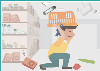
백화점, 마트에 있을 경우

진열장에서 떨어지는 물건으로부터 몸을 보호 하고, 계단이나 기둥 근처 로 가 있습니다. 흔들림이 멈추면 밖으로 대피합니다.