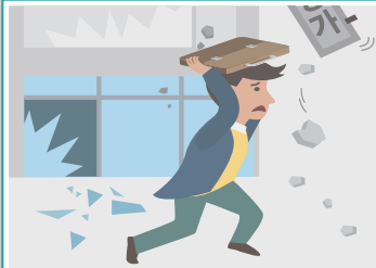
집밖에 있을 경우

떨어지는 물건에 대비하여 가방이나 손으로 머리를 보호 하며, 건물과 거리를 두고 운동장이나 공원 등 넓은 공간 으로 대피합니다.