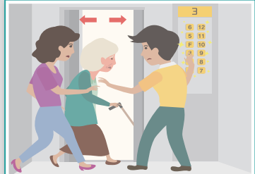
엘리베이터에 있을 경우

모든 층의 버튼을 눌러 가장 먼저 열리는 층에서 내린 후 계단을 이용합니다. ※ 지진 시 엘리베이터를 타면 안됩니다.