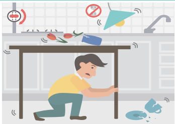
집안에 있을 경우

탁자 아래로 들어가 몸을 보호합니다. 흔들림이 멈추면 전기와 가스를 차단 하고 문을 열어 출구를 확보 한 후, 밖으로 나갑니다.