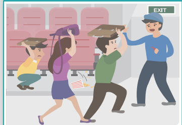
극장, 경기장에 등에 있을 경우

흔들림이 멈출 때까지 가방 등 소지품으로 몸을 보호 하면서 자리에 있다가, 안내에 따라 침착하게 대피합니다.