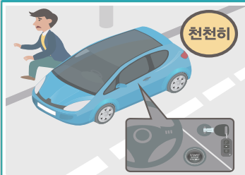
운전을 하고 있을 경우

비상등을 켜고 서서히 속도를 줄여 도로 오른쪽 에 차를 세우고, 라디오의 정보를 잘 들으면서 키를 꽂아 두고 대피합니다.