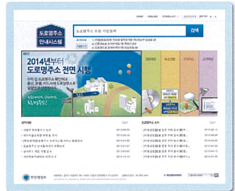
〈 도로명주소 홈페이지 www.juso.go.kr 〉