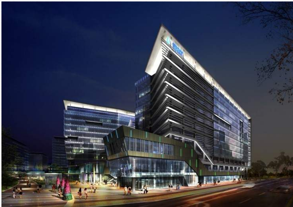
쿡앱스 판교 사옥 경기도 성남시 분당구 대왕판교로 660 유스페이스 1B동 8층