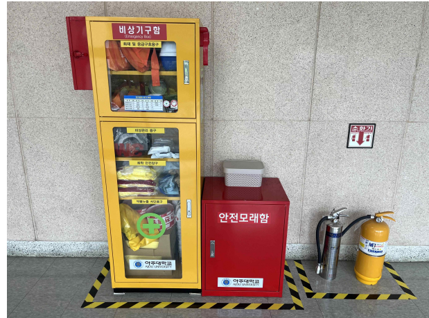
원천관 2층 복도