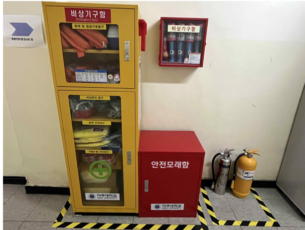
원천관 1층 복도