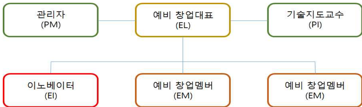
- (그림1) 실험실 창업 탐색팀 구성도 -