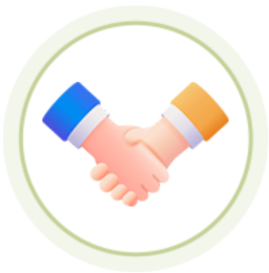
디자인씽킹 워크샵 참여 기회