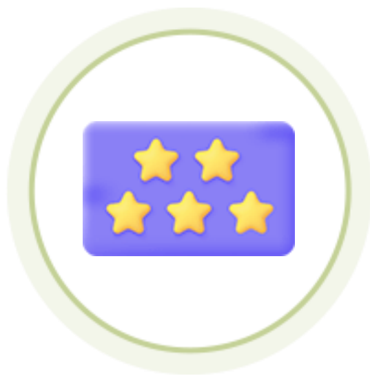
굿네이버스 채용 가산점