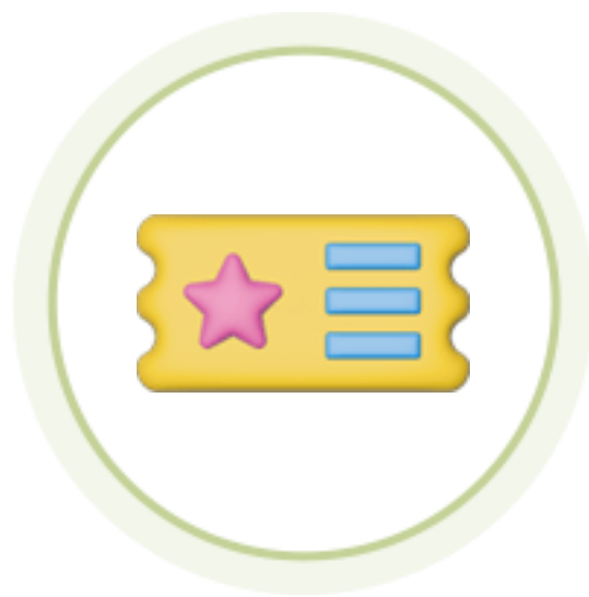
자기개발학습 콘텐츠 이용권