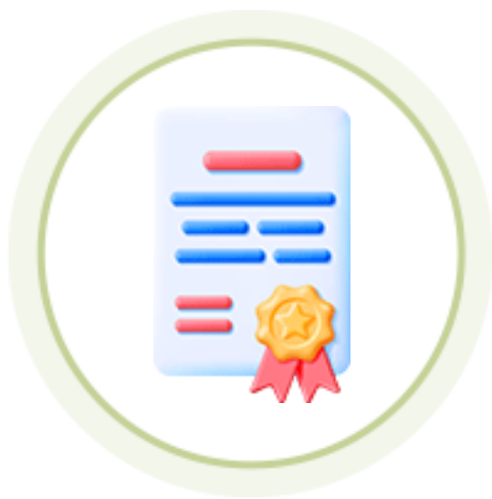
인성역량 강화과정 자격요건