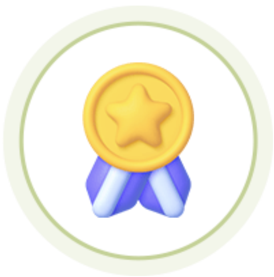
인성 인증 면접 배지