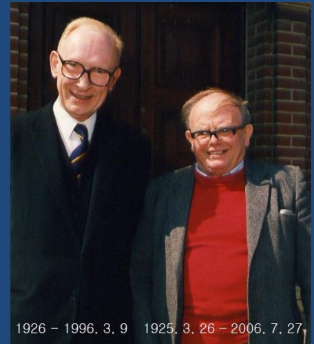
‘The Principles of Humane Experimental Technique’ (Russell & Burch, 1959)