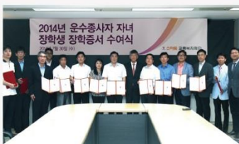
스마트 교통복지 재단 설립 시민 편의 및 대중교통 이용자를 위한 시설투자 등 사회공헌 활동