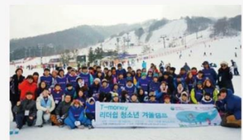
Tmoney 리더십 청소년캠프 운수사 자녀 대상 하계 및 동계 청소년 캠프 주최