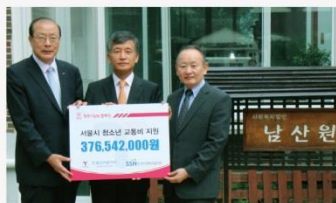
사회공헌 "행복나눔N" 캠페인 저소득층 청소년 교통비 지원