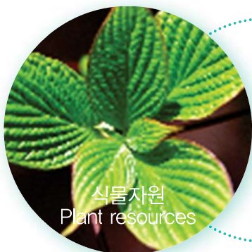
식물자원 Plant resources

식물세포주 (Plant cell lines), 종자 (Seeds), 추출물 등