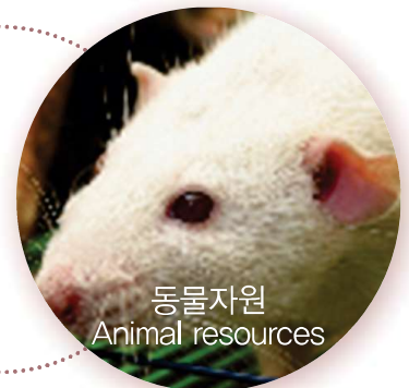
동물자원 Animal resources

인간세포주 (Human cell lines), 동물세포주 (Animal cell lines), 융합세포주 (Hybridomas), 줄기세포주 (Stem cells), 설치류 배 (Murine embryos), 수정란 (Embryos), 정자 (Sperms) 등