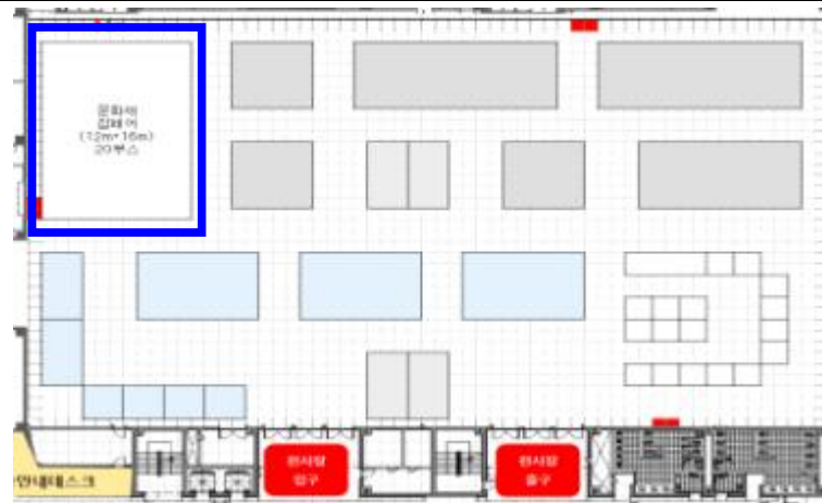
〈HICO 1층 활용관〉