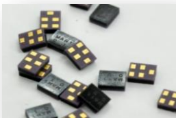
SAW Filter (Surface Acoustic Wave)

와이솔은 휴대폰에 사용되는 SAW Filter, Duplexer와 Duplexer를 활용한 Module 제품을 생산·판매하는 사업을 주력으로 하고 있으며, 신성장 동력 확보를 통한 매출증대 및 사업의 다각화를 달성하기 위하여 스마트TV에 탑재되는 Bluetooth, Wi-fi, Zigbee 등 RF 모듈사업을 영위하고 있습니다.