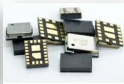
GLM (GPS LNA Module)

종업원수 : 744명('14년 11월말) ※ 한국 : 306명, 천진 : 438명