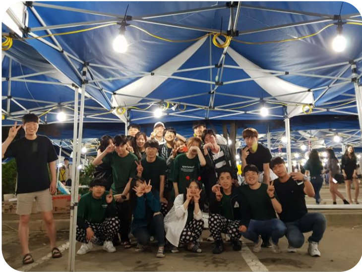
대동제 주점 사업