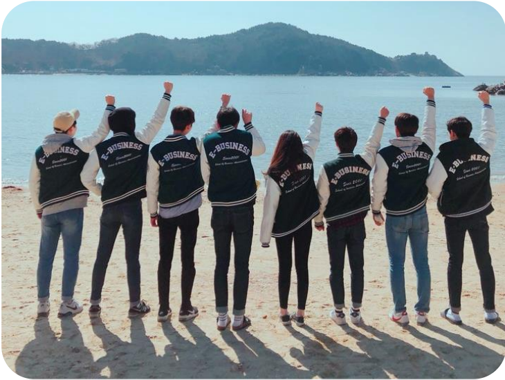
과잠 공구 사업