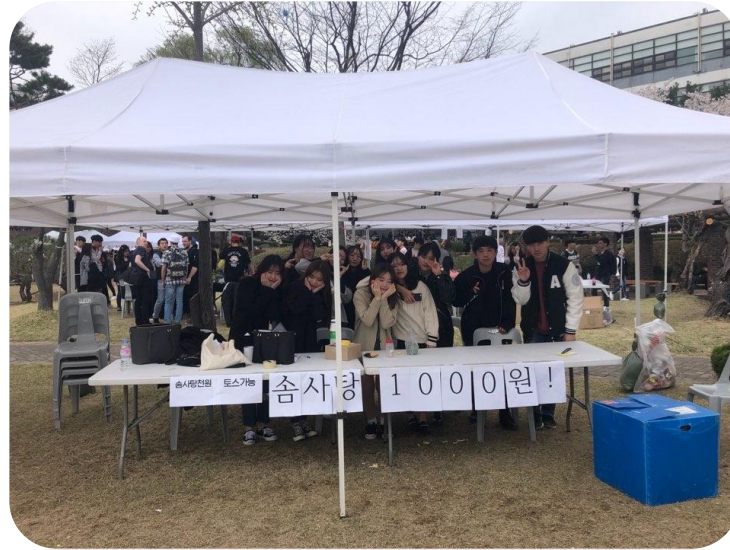
그룹 멘토링 1:1 멘토·멘티