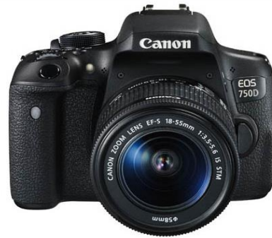
아이패드·카메라 대여 사업