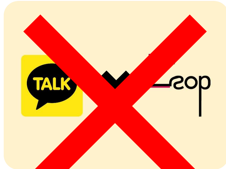
카카오톡 플러스친구 “아주대학교 e-Business학과”