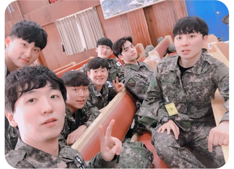
예비군 간식 사업