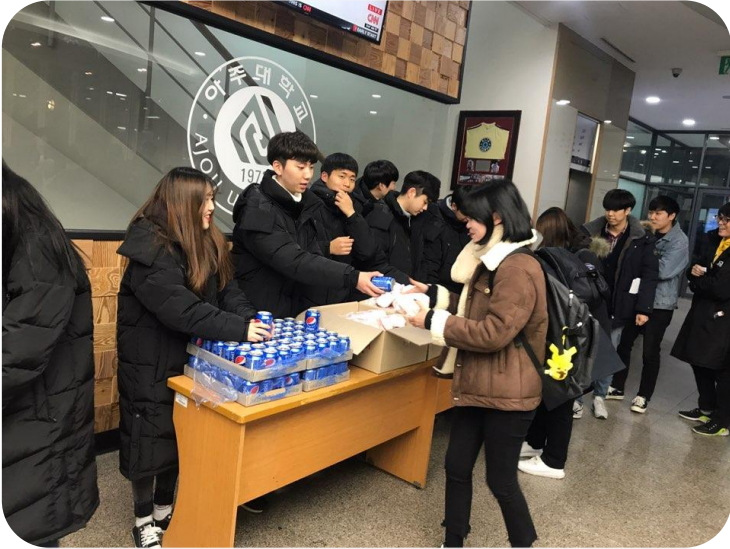
중간·기말고사 간식 사업