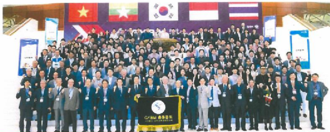
2019.12.14 GYBM 총동문회 창립대회 단체사진 (베트남 하노이 NCC)