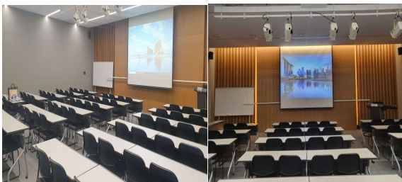
70인 이상 수용 가능