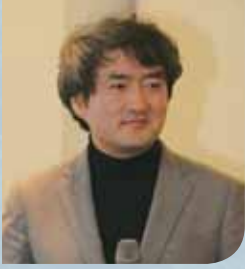
평생교육원장/ 교육학 박사