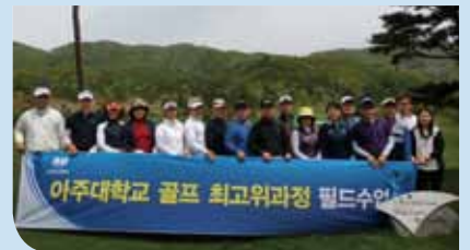
2015.5.6~7 휘닉스파크GC 워크숍