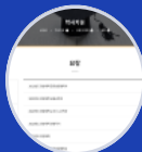
요람 대학교육과정 ->경영대학