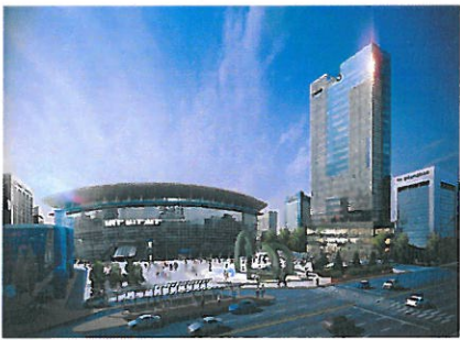
부산역 라마다앙코르호텔 (20)