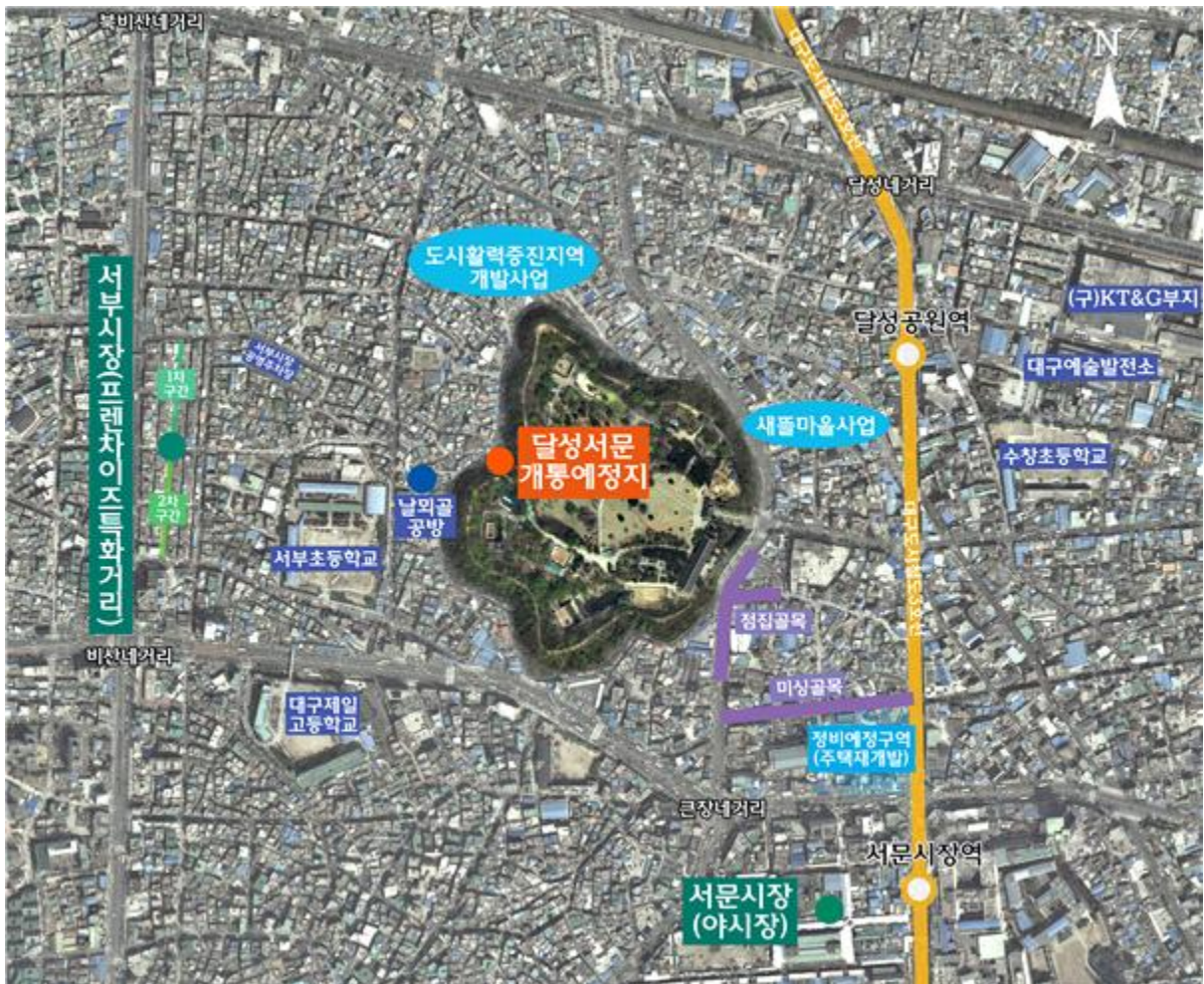
<대상지 및 인근 현황도>

1) 대상지 : 달성 일원(단, 현 달성공원 내부는 아이디어 제안 범위에서 제외함)