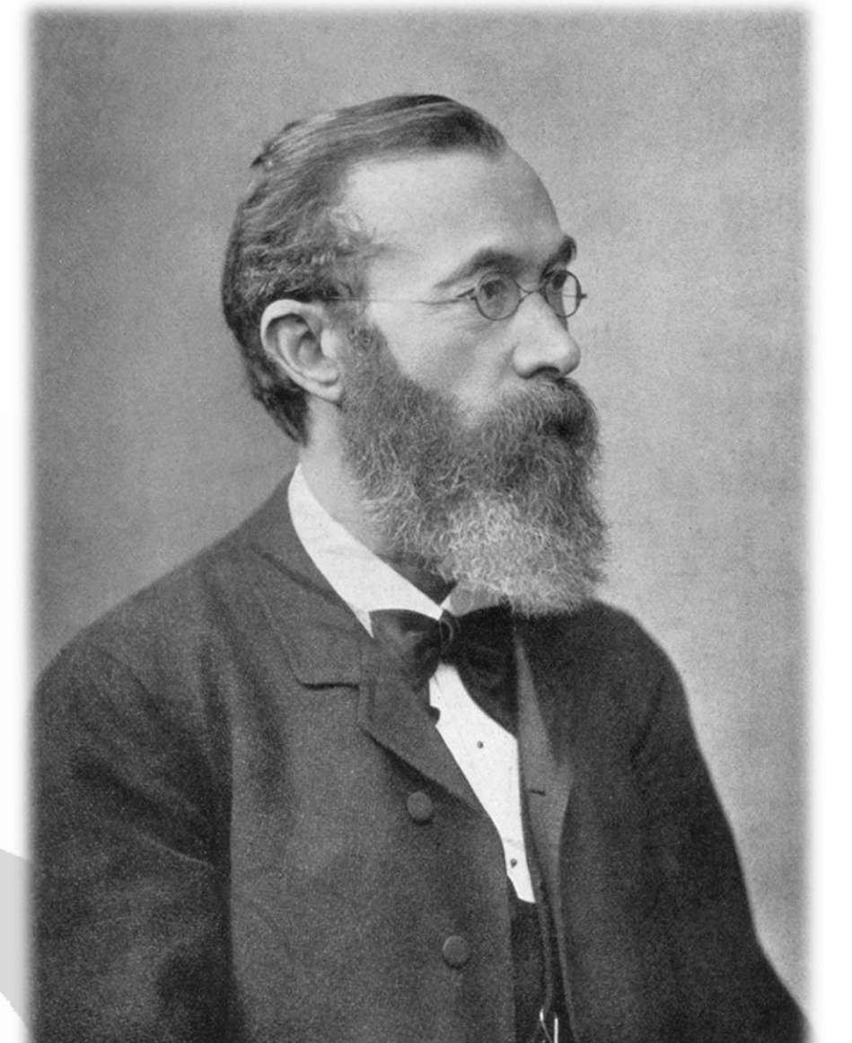
빌헬름 막시밀리안 분트 (1832~1920)