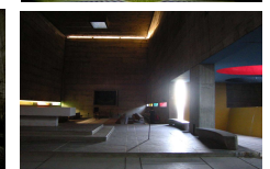
Richard Wagner - Lohengrin