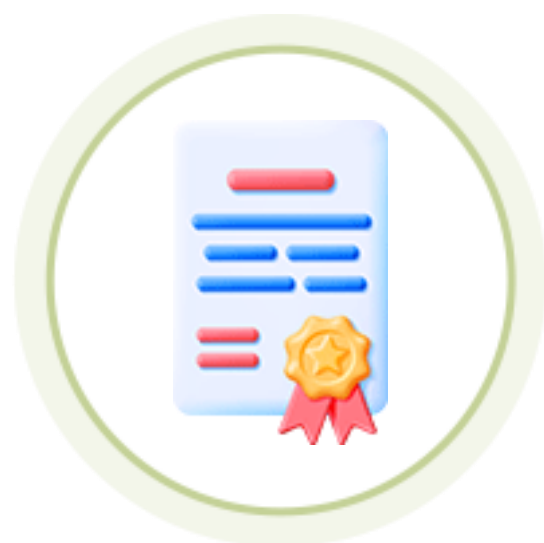
인성역량 강화과정 자격증