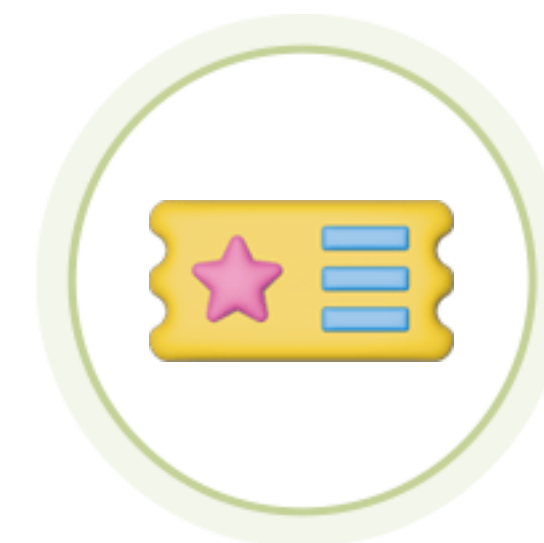
자기개발학습 콘텐츠 이용권