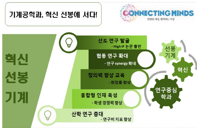
<그림 1> 기계공학과 혁신 선봉에 서다